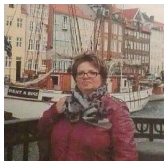
Hebrew Version's Editor